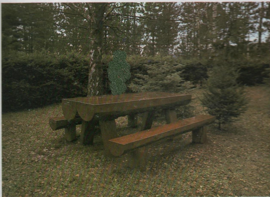
СТО СА ДВЕ КЛУПЕ БЕЗ НАСЛОНА