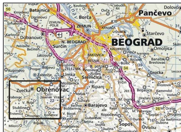
Slika br. 1

Vazдушnom linijom, državna granica je od Obrenovca udaljena oko 80 kilometara ka istoku. U Obrenovcu se ukrštaju važni putevi, koji od Beograda, udaljenog svega 29 kilometara ka istoku, vode na zapad ka Šapcu, Loznici i zatim Bosni i Hercegovini i Hrvatskoj, odnosno ka Valjevu i Ibarskoj magistrali.